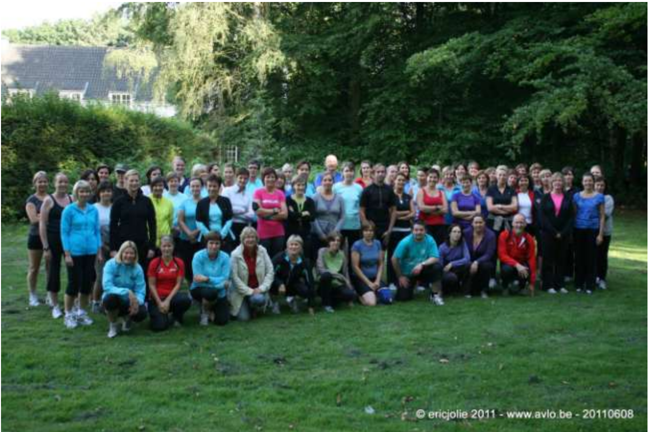
Deelnemers test starttorun 5 km