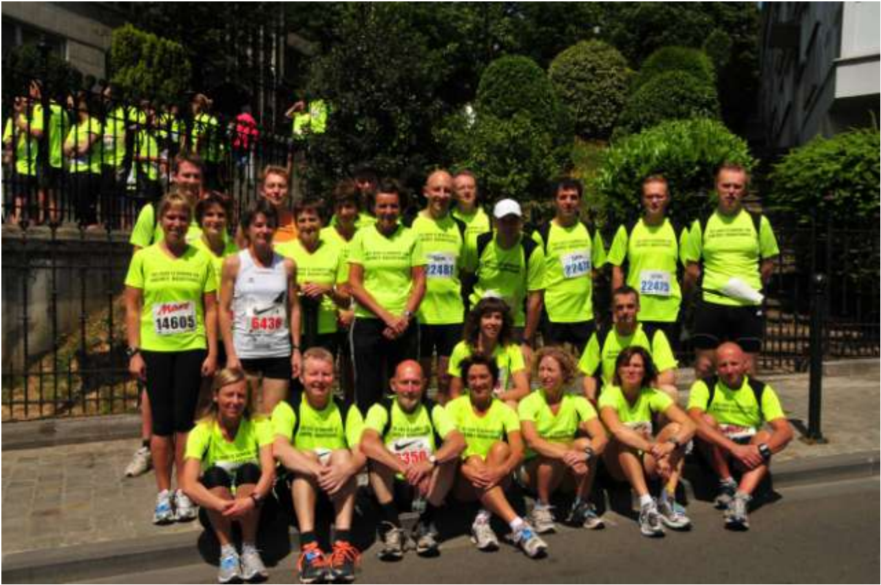
AVLO –loopgroep 20 km door Brussel