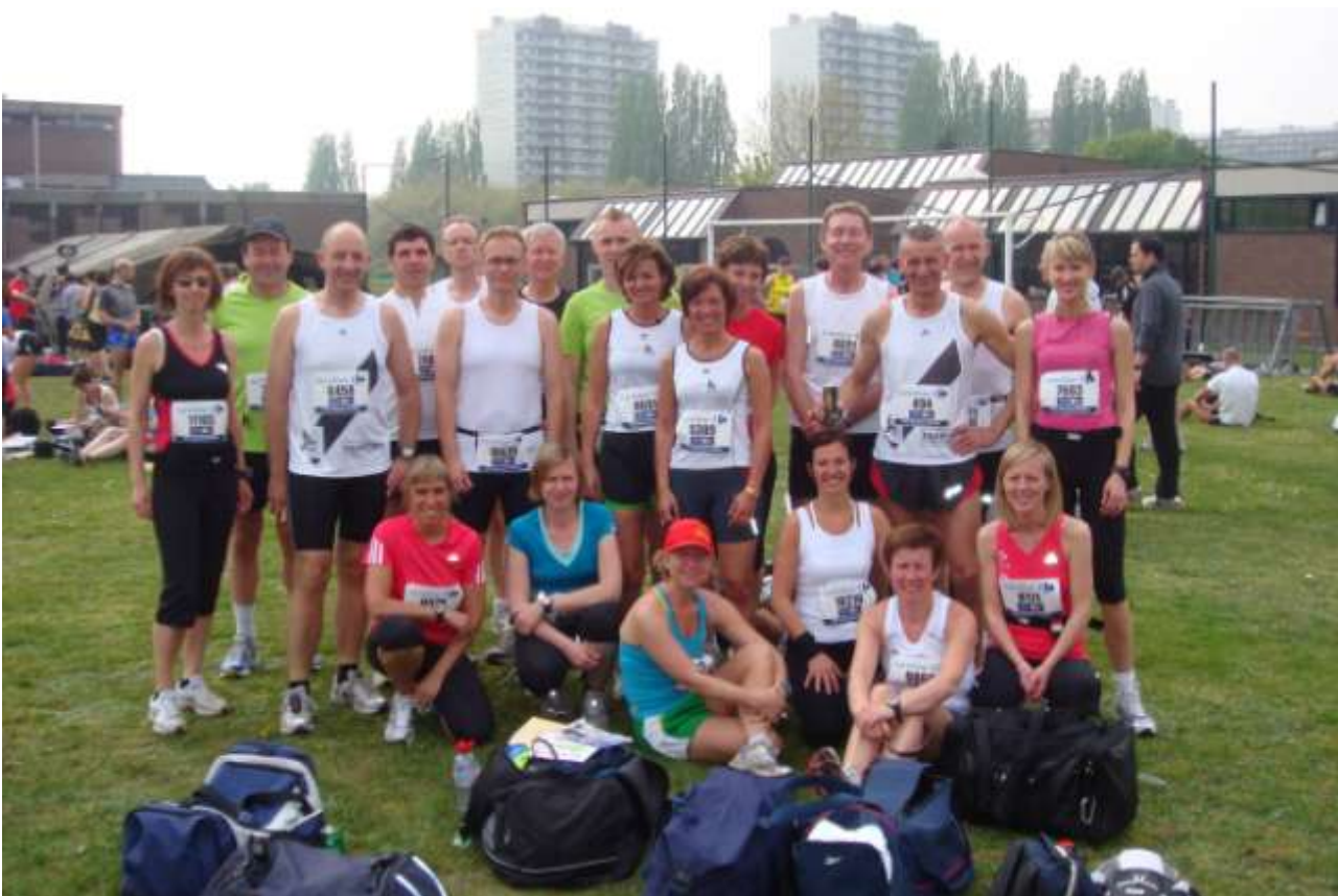
AVLO-loopgroep 10 mijl Antwerpen